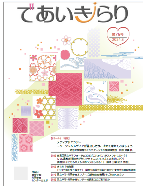
センター機関誌 (区民との協働編集)