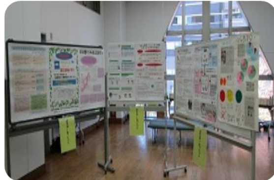
男女平等・共同参画センター 運営委員会