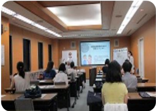
講座の実施 広報、啓発活動

女性問題の解決及び男女が平等に共同参画し性の多様性を尊重する社会の実現に資することを目的とした学習の場として、また交流や活動の拠点として、どなたでも利用できます。