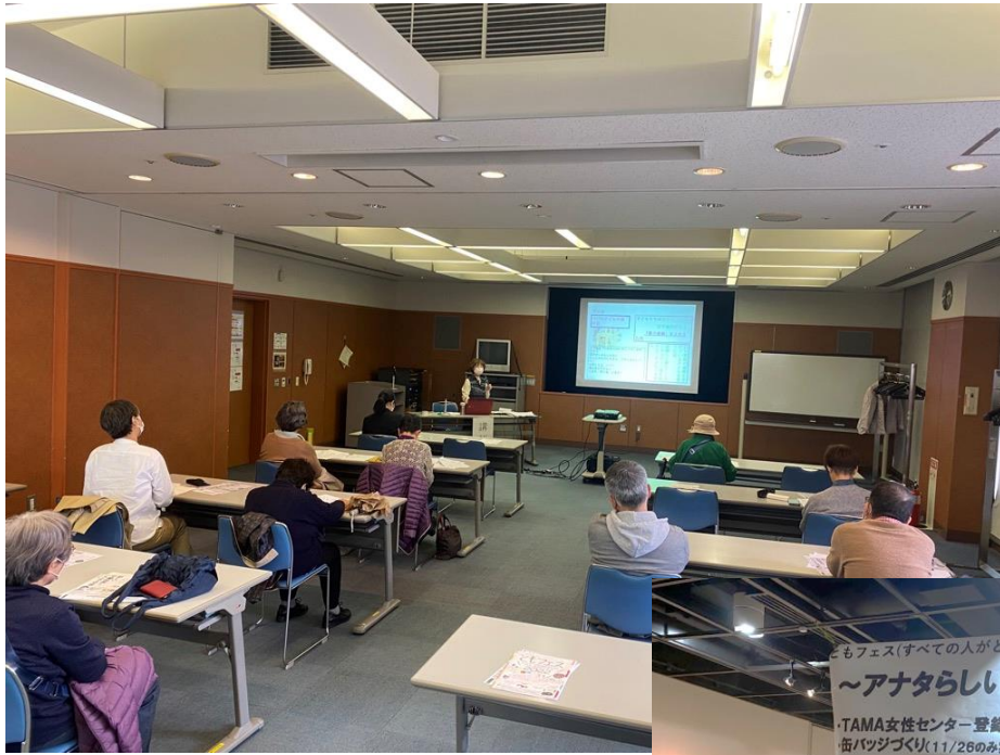
▲昨年度の様子 (性と生に関する講演会)