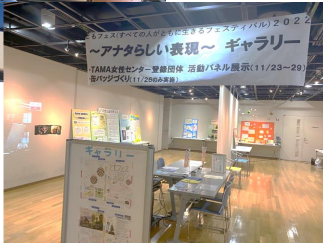
昨年度の様子 ▶ (パネル展示)