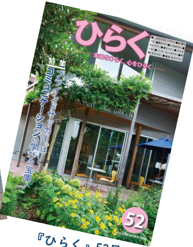
『ひらく』52号 (令和5年3月発行)