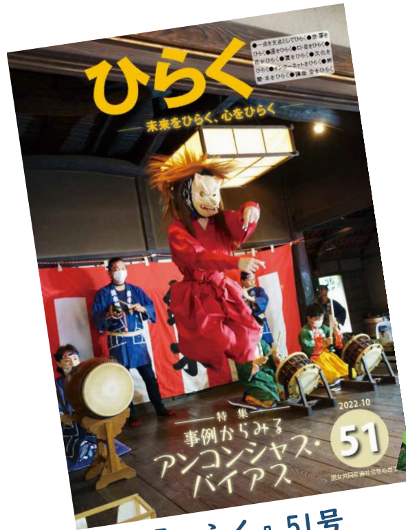
『ひらく』51号 (令和4年10月発行)