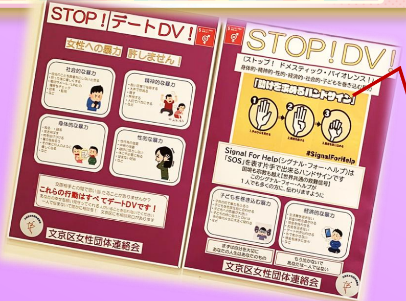
2枚のパネルを展示

カラーリボン (アウェアネス・リボン) には、その色ごとにさまざまな社会問題への理解や支援のメッセージが込められています。このカラーリボンの意味やリボンにまつわる社会運動について、活動団体や区担当課をご紹介します。