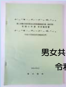
第二次東大和市 男女共同参画推進計画（改訂版） 令和2年度 年次報告書 R4.2月 発行