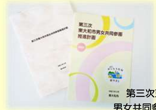
第三次東大和市 男女共同参画推進計画