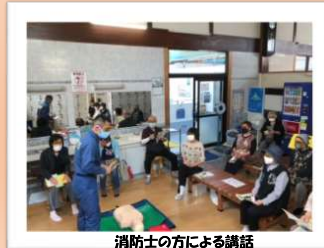
消防士の方による講話