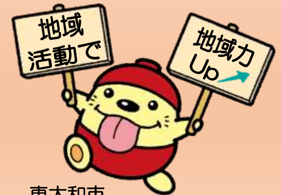
東大和市 観光キャラクター うまべえ