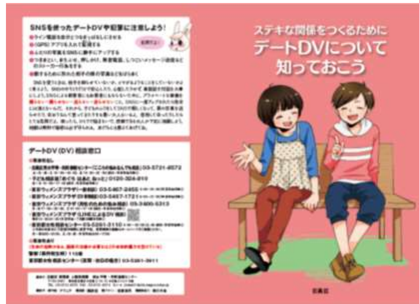
デートDV啓発冊子 (公立中学校第3学年に配布)