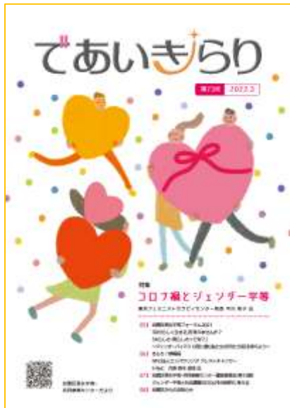
男女共同参画情報誌 (区民と協働編集)