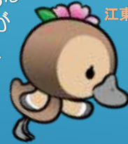
江東区観光キャラクター コトミちゃん