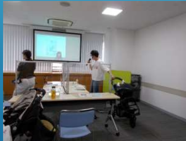
▲別室会場。1歳6か月未満のお子さんと同僚受講できます。映像や音声を共有します。