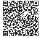
ライブ配信用 申込フォーム

視聴には、パソコン・スマートフォン・タブレット等の通信機器とインターネット環境が必要となります (スマートフォンとタブレットは、事前に Zoom アプリのダウンロードが必要です)。開催3日前までに、お申込み時に記載いただいたメールアドレスに Zoom の URL 等を送信いたします。視聴にかかる通信費は視聴する方のご負担となります。後日のアーカイブ配信はございません。