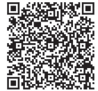
録画上映用 申込フォーム

※車椅子でのご来場又は手話通訳などのご希望がある場合には、申込時にお知らせください。